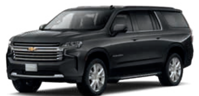
GRIS ASFALTO METÁLICO